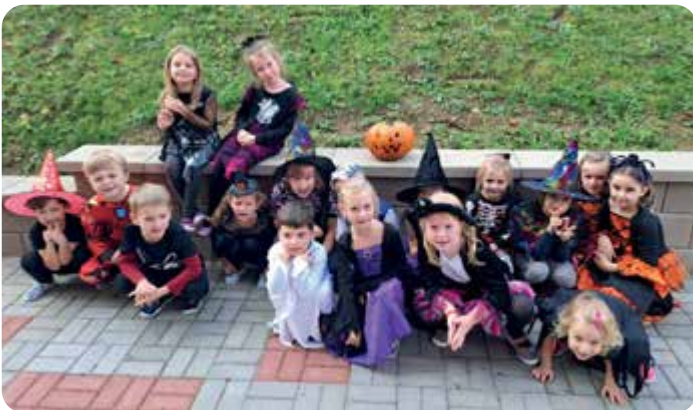
Děti z mateřské školy si užily veselý Halloween plný strašení. Nechybělo ani létání na koštěti a míchání lektvarů!