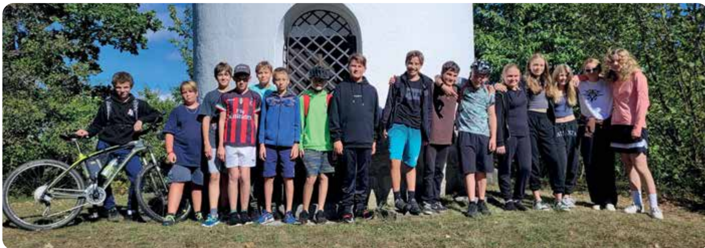
VII.A v září vyrazila na výlet na kolech.