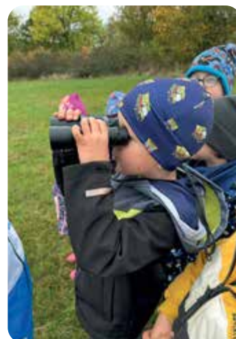
Oslavujeme s dětmi Den stromů. Sbíráme přírodniny a pozorujeme, jak čaruje podzim.