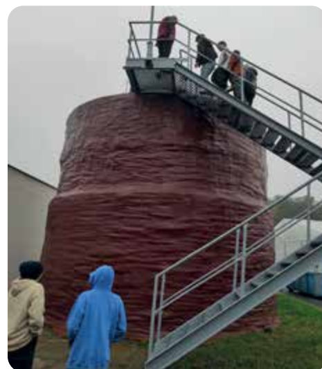
Osmáci se vydali také do čistírny odpadních vod.