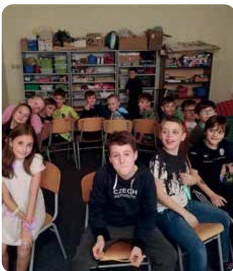
Pátáci si užili noc ve škole i stezku odvahy.