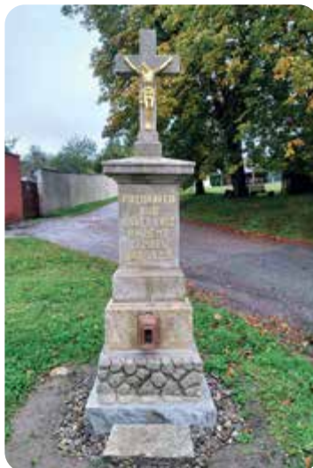
Zrestaurovaný kříž v Předenicích.

Tento zápis se psán v Onšovicích dne 1. srpna léta Páně 1981 pro příští generace a uložen v kříži.