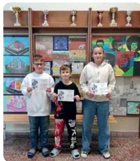
Ze školního kola Logické olympiády.