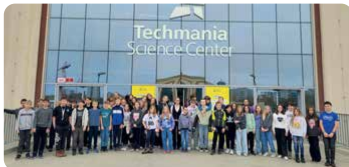
Sedmáci a část šestáků vyrazili v listopadu do Techmanie do Plzně.