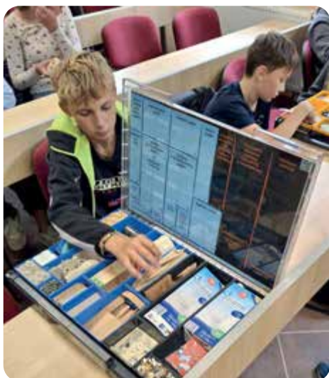
Sedmáci navštívili třídírnu odpadu Jihošepar ve Vimperku.