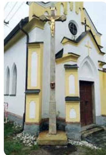
Křížek v Onšovicích po opravě.