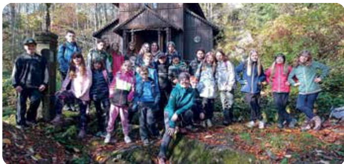
V říjnu si šestáci s třídní učitelkou a asistentkou užili adaptační pobyt ve Stožci.