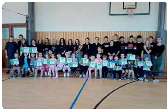
Tradiční pasování prvňáčků – devětáci si pro naše nejmenší připravili stezku, která prověřila jejich obratnost, hbitost, přesnost a mysl.