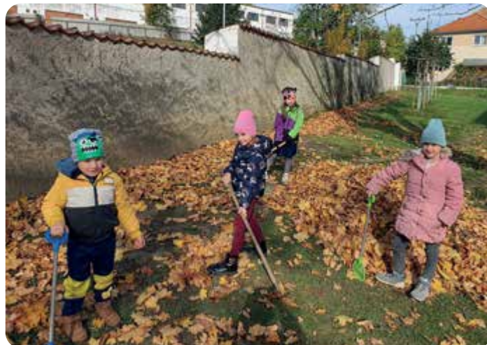
Pomáháme s úklidem naší krásně probarvené zahrady. Máme spoustu pomocníků, hrabání listů je hračka!