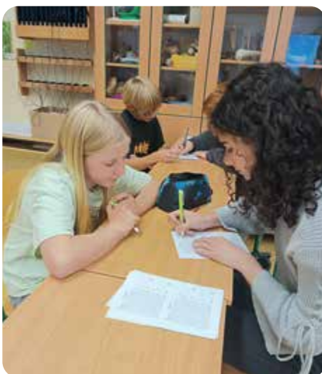
Historicky první turnaj v piSQworkách – postupujeme do okresního kola, které se uskuteční u nás ve škole...