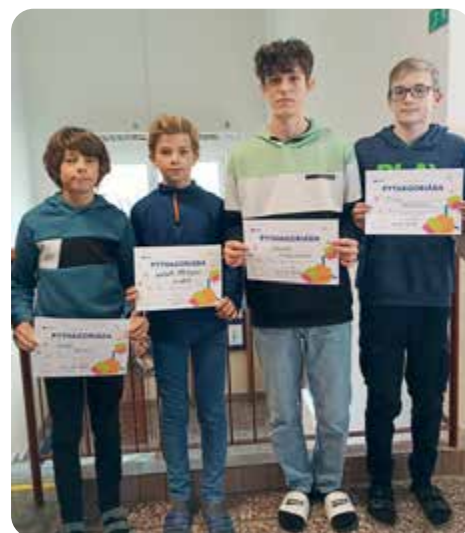
Ze školního kola Pythagoriády máme postoupivši do okresního kola.