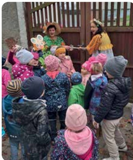
„Zamykání zahrady s vílou Podzimničkou.“ Děti se rozloučily s létem, uzamkly zahradu a uspaly zvířátka.

Podzim létu zamával, ahoj léto, musíš jít. Ruku svou mu podával, prostě to tak musí být.