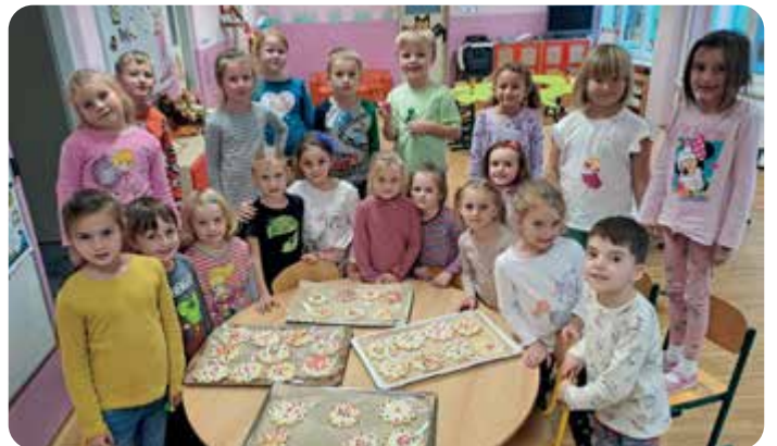
„To je zlaté posvícení!“ V naší MŠ máme samé šikulky. Děti nám napekly krásné hnětynky, které voněly po celé školce.