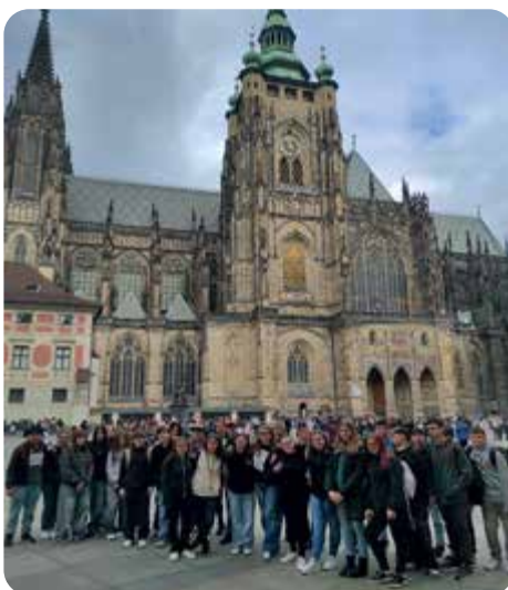
Osmáci vyrazili do Prahy, kde navštívili Pražský hrad a Národní zemědělské muzeum.