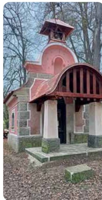
Kaplička ve Zdůli před rekonstrukcí a po ní.