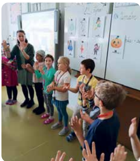
Z kroužku angličtiny pro druháčky.