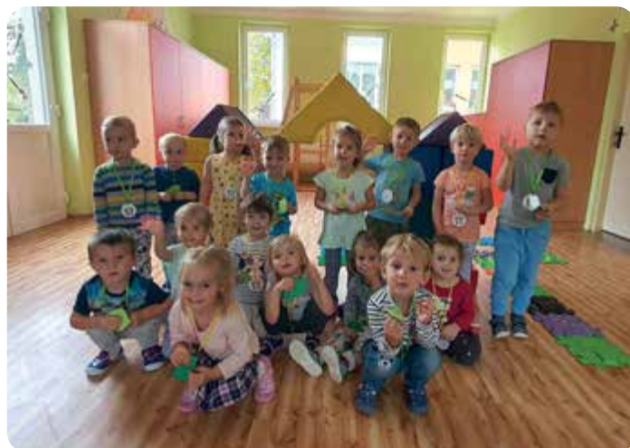
Pasujeme prvňáčky, vítáme nové kamarády mezi námi.