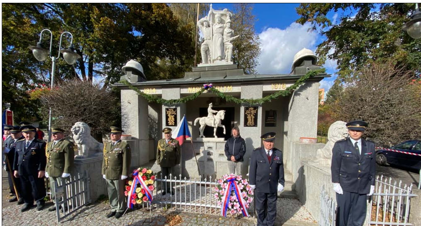
Památník padlých zdobí opět jezdecká socha T. G. Masaryka.